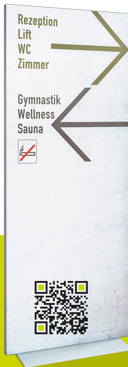
Profil AF33 | Stele

Die seidenmatten Drucke sind spiegelungsfrei.