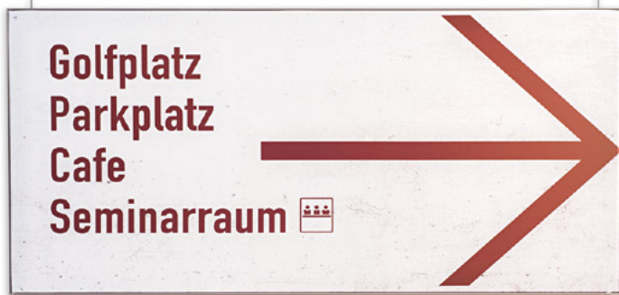
Profil AF33 | Hängeschild