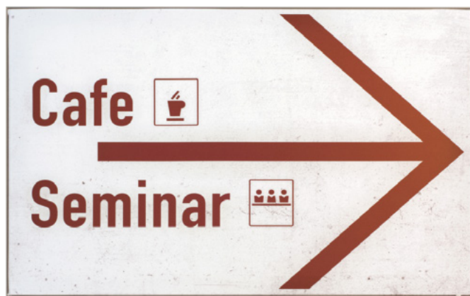
Profil AF33 | Fahnschild